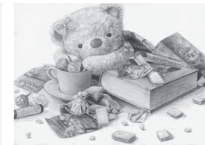
「ん~どれにしようかな!」