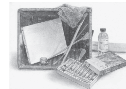
「これからもよろしくね」