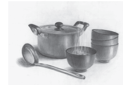
「おかえり、今温めるね」