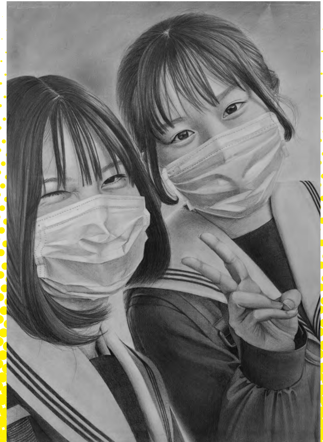
第5回鉛筆デッサンコンクール大賞「コロナ禍の友情」