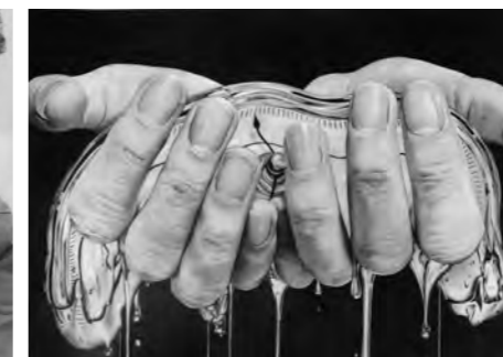
「こぼさないように」