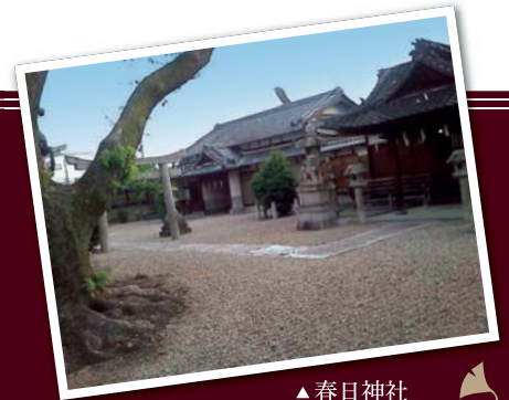
▲春日神社 JR畝傍駅前 橿原市八木町